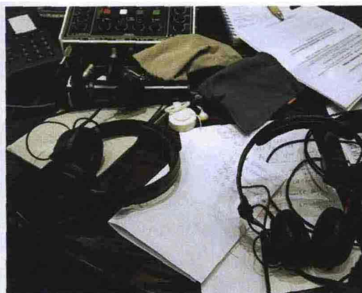
Uno studio di Sky. In basso: Luciano Moggi e, a destra, Agostino Saccà