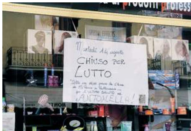
A lutto il negozio dove lavorava Antonella