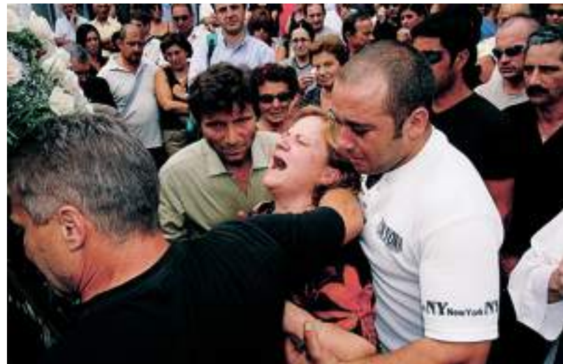
All'esterno della chiesa, le urla di disperazione di una delle zie