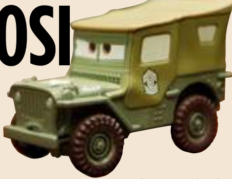
FANTOZZI a pagina 6

La Mattel costretta a ritirare 18 milioni di macchinine perché contengono piombo