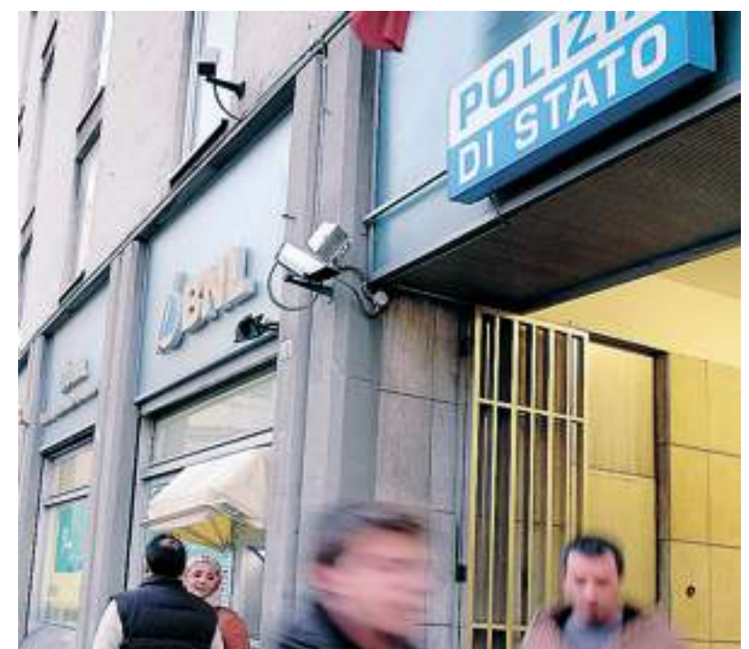
Il commissariato di polizia Centro dovrebbe essere accorpato con Pré