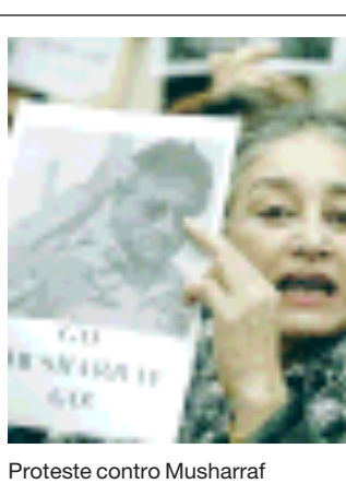
Proteste contro Musharraf

ROMA — Episodio di bullismo in una scuola media di Roma. Un ragazzo di 14 anni è finito in ospedale. Dopo avergli gridato "sei marocchino" i compagni l'hanno pestato, colpendolo alla testa e procurandogli ferite alle mani. Il ragazzo di origine straniera è stato soccorso da una donna che ha chiamato il 113. Il 14enne ha raccontato di essere stato circondato e aggredito da alcuni coetanei. La polizia, avuto notizia di ferite alla testa, ha girato subito la nota anche al 118, che l'ha trasportato all'ospedale Santo Spirito. MAISTO E RADICE A PAGINA 19