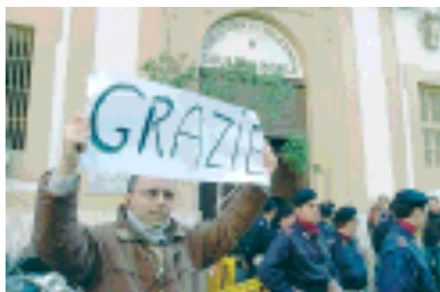
Un cartello di ringraziamento alla polizia dopo il blitz