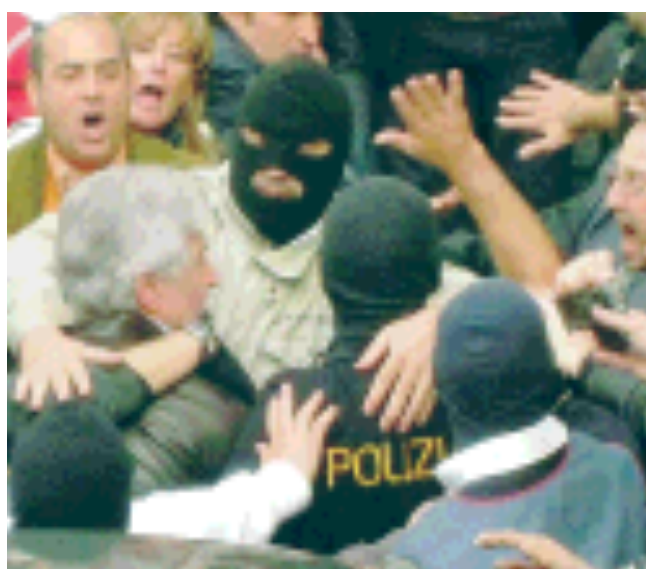
L'arresto del boss Lo Piccolo

UNA PARTITA ANCORA APERTA GIUSEPPE D'AVANZO COSA Nostra non è invincibile. Se ci appare ciclicamente inattaccabile nel nucleo centrale del proprio sistema di potere e del network di relazioni che la protegge, lo si deve soltanto alla ciclica debolezza dello Stato e della società siciliana; alle molteplici linee di frattura che hanno impedito di chiudere la forbice tra repressione giudiziario-poliziesca e rinnovamento politico ed economico. SEGUE A PAGINA 24 PALAZZOLO E ZINITI ALLE PAGINE 2 E 3