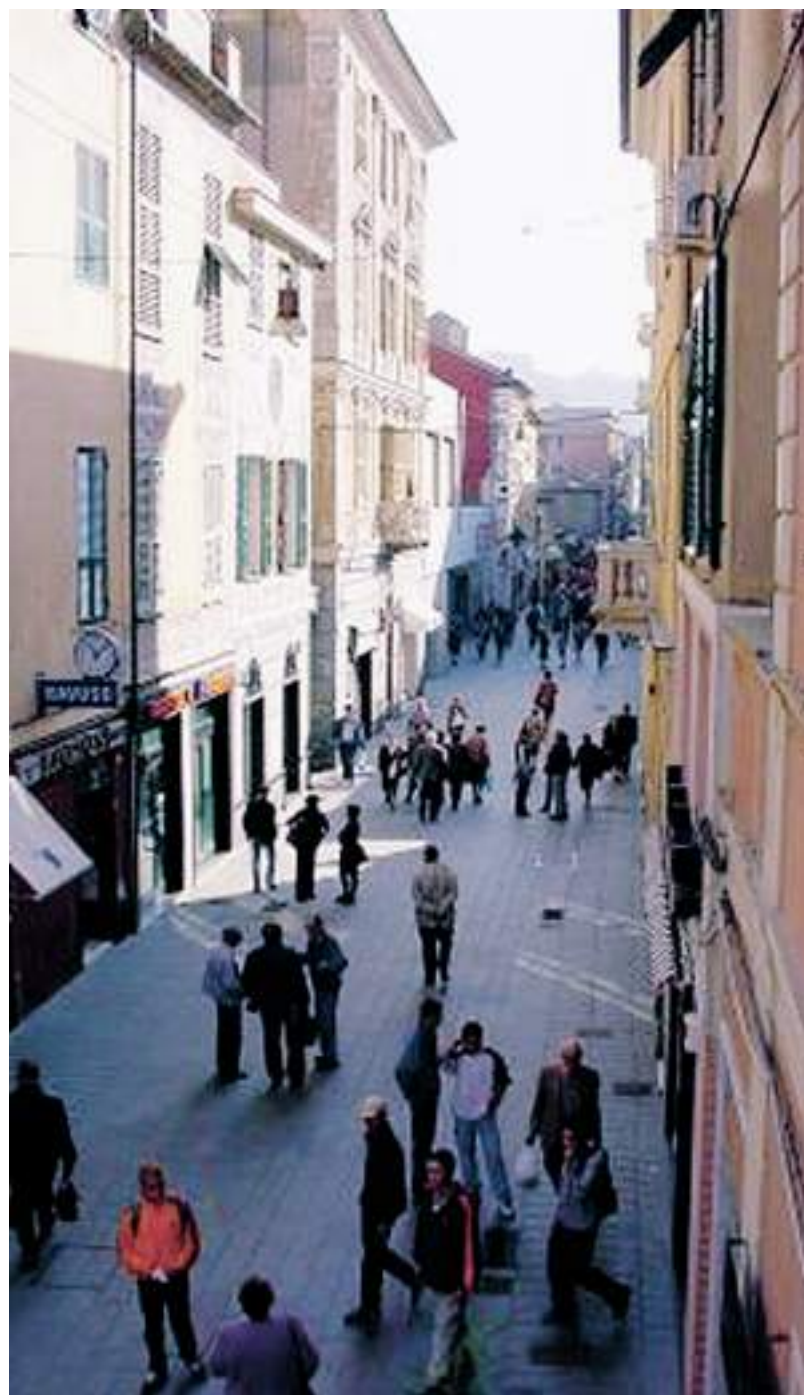
Via Sestri, uno dei cuori commerciali del Ponente genovese