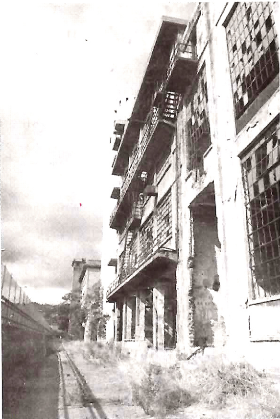
L'ex oleificio Gaslini a Rivarolo

Nelle schede depositate in procura figurano anche funzionari pubblici di società genovesi