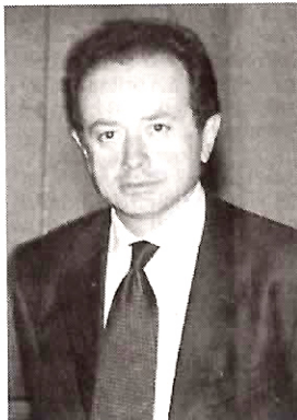
Il pm Francesco Pinto

Coinvolte nelle indagini la società "Per Cornigliano" e "Sviluppo Genova" oltre ad una costellazione di piccole, medie e grandi imprese del settore edile