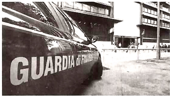
L'indagine è stata condotta dalla Finanza

avviare indagini più approfondite. A quel punto i vari ambienti politici erano stati messi sotto controllo: cimici (si ricorderà quella trovata all'interno della Filse, la finanziaria della Regione Liguria), telefoni intercettati (vedi quelli di Striano, Casagrande, Fedrazzoni), pedina-