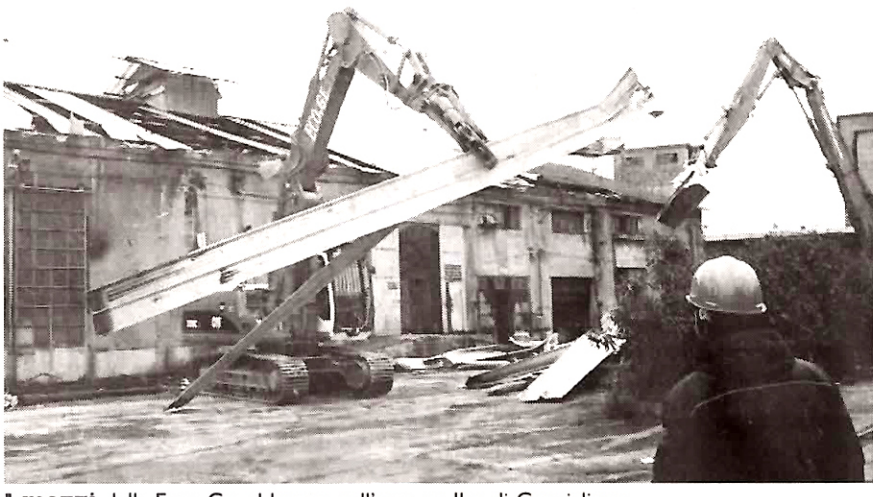
I mezzi della Eco.Ge. al lavoro nell'area ex Ilva di Cornigliano

LA GENESI DELL'INCHIESTA DEL PM FRANCESCO PINTO