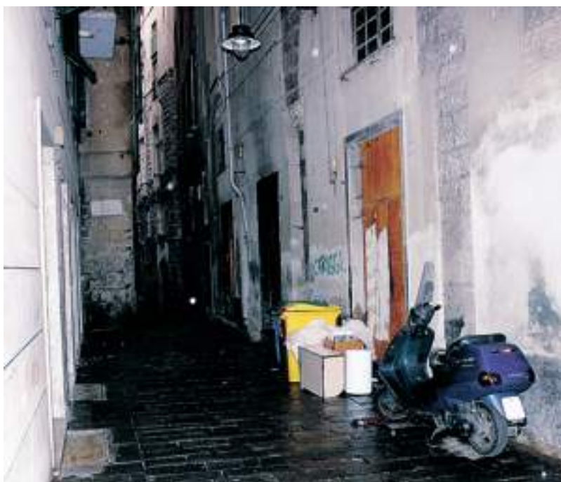
Vico Spinola, teatro dell'accoltellamento