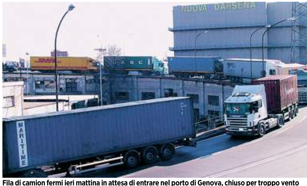
Fila di camion fermi ieri mattina in attesa di entrare nel porto di Genova, chiuso per troppo vento

CAFASSO, GRILLO, SCHIAFFINO e commento di ROBERTO ONOFRIO >> 2 e 23