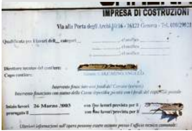
Il pannello del cantiere: la data di fine lavori è coperta