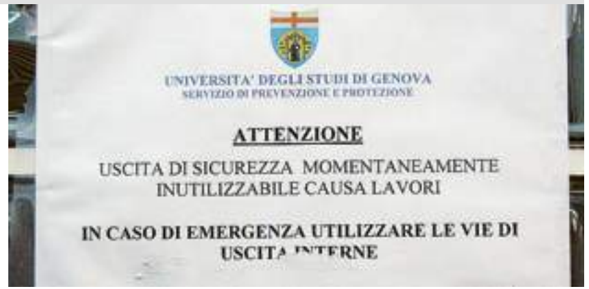
L'uscita di sicurezza? Non si può usare