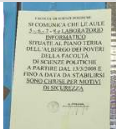
Aule chiuse per "sicurezza"