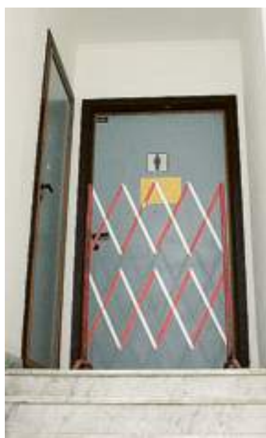
Bagni vietati per i maschi

tempio genovese del sapere è segnato da tre cassonetti dell'immondizia. Ormai fanno parte del panorama, tanto che gli studenti ci attaccano i loro annunci. Poi ecco il piazzale: sporco, erbacce e migliaia di cicche di sigaretta. Sotto - ma c'è la speranza che il visitatore distratto non ci getti l'occhio - una specie di fossato è stato trasformato in una discarica del cantiere. Ma non illudetevi, è soltanto l'inizio. Dentro è peggio. Percorrete il lungo corridoio che porta alle aule. Ecco, qui si potrebbe allestire una mostra raccogliendo tutti i cartelli di divieto affissi. Decine, tanti che alla fine non si capisce più che cosa si può e non si può fare. Una breve antologia: «Le aule 5-6-7-8 sono chiuse per motivi di sicurezza dal 12 marzo» è scritto sulle porte. Ma poi la porta è aperta. Mistero. «Le aule sono state inaugurate da poco, ma all'inizio dell'anno cadevano pezzi di soffitto. Così a marzo hanno fatto dei