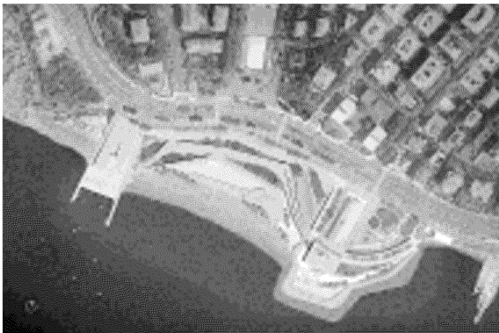
Il nuovo progetto del Lido visto dall'alto