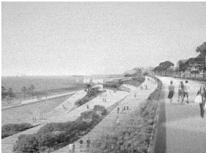
Il progetto elaborato al computer dei nuovi Lido