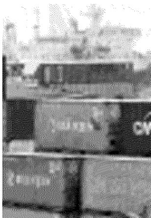
Container in porto

Un tempo i portuali dicevano in dialetto: «Qui hanno da passare». A significare che quelle di Genova erano le uniche banchine in grado di assicurare le condizioni per gestire il traffico portuale. Poi ci si è accorti che non era più così. E cominciò per lunghi anni la "grande fuga" degli armatori. Ora la paura è che le navi vengano messe in fuga non dalla conflittualità in banchina ma dai sequestri e dai processi.