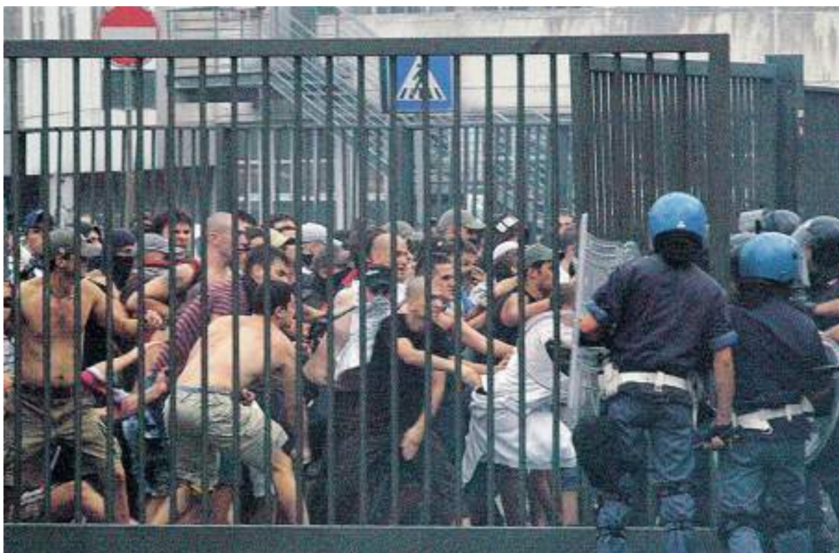
Ultras dell'Hajduk Spalato forzano le cancellate intorno allo stadio di Marassi prima dell'incontro con la Samp