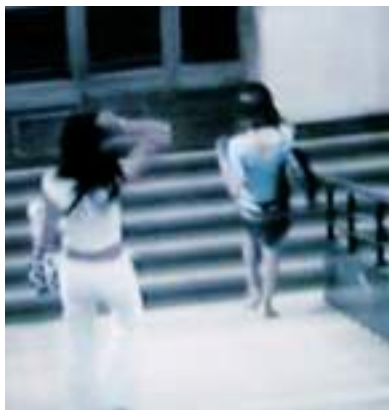
Prostituite a Genova (foto d'archivio)