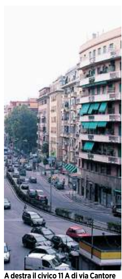
A destra il civico 11 A di via Cantore