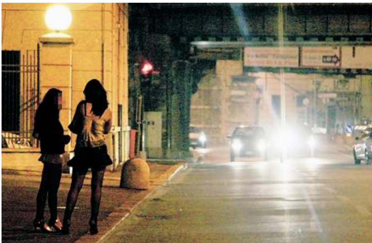
Due giovanissime prostitute aspettano clienti in via Fiumara, a Genova, sabato notte