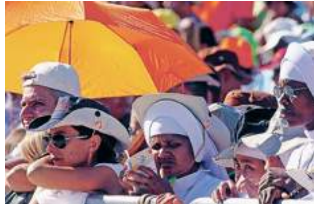
Fedeli assistono alla messa celebrata dal Papa a Montorso

«Anche da un punto di vista etico e spirituale - prosegue Bagnasco - i gio-