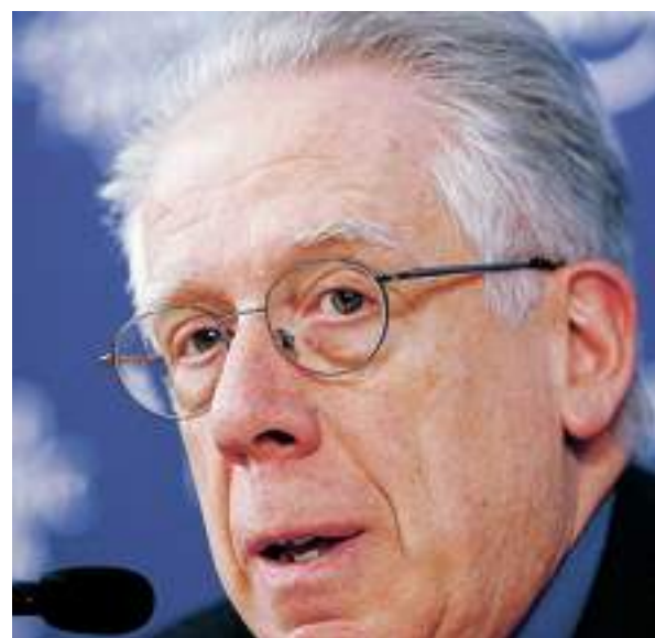
Il ministro dell'Economia Tommaso Padoa-Schioppa