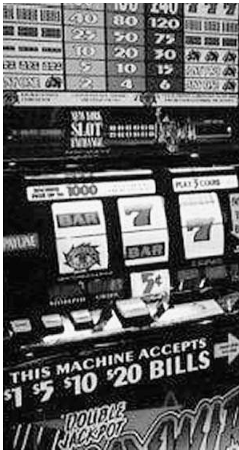
Anche le slot-machine sono finite nel mirino delle Procure