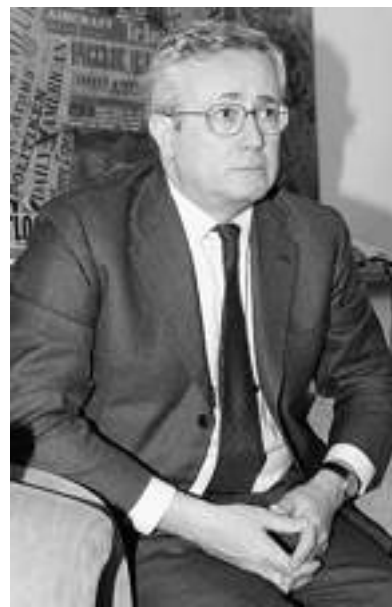
L'ex ministro Giulio Tremonti