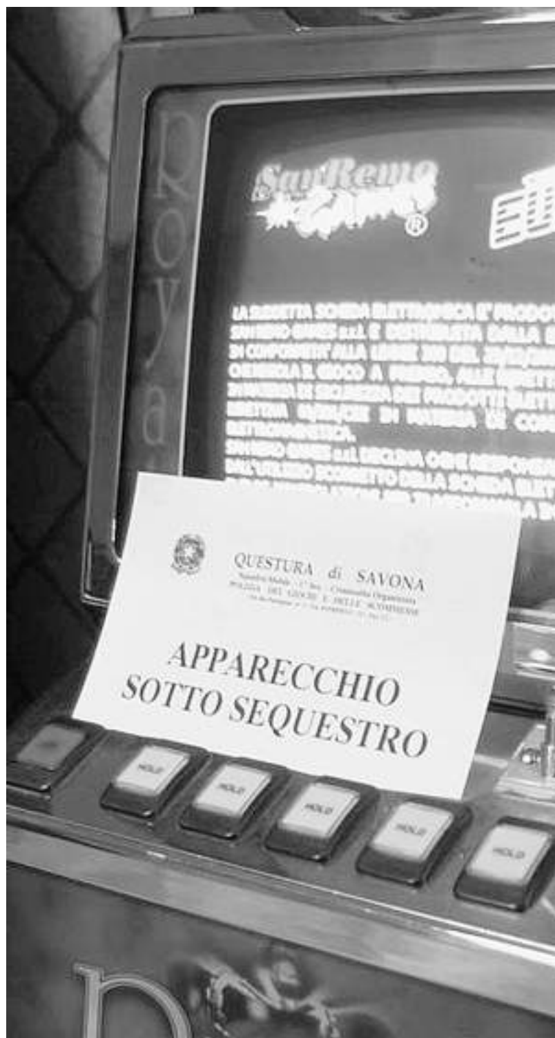
Un videopoker irregolare sequestrato in Liguria dopo i controlli