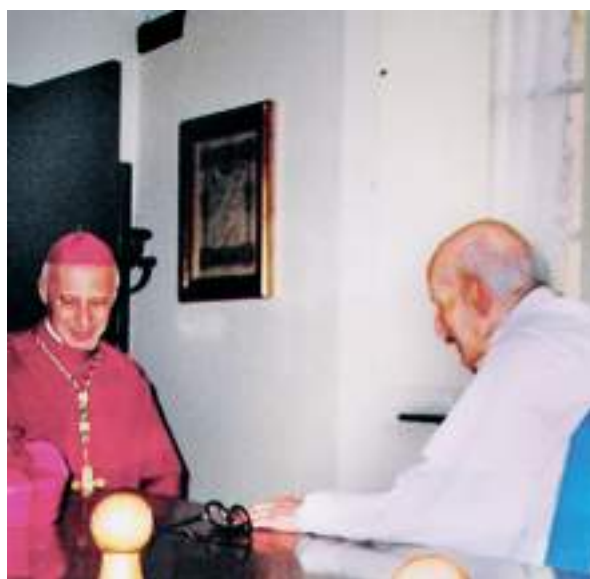
L'arcivescovo Angelo Bagnasco con Padre Rovasenda