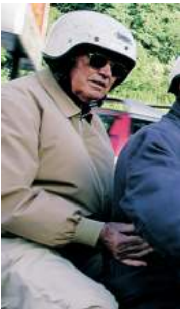
Erik Priebke ieri in moto