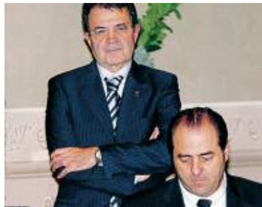
Romano Prodi in piedi e Antonio Di Pietro

Di Pietro chiede che la questione venga affrontata in Consiglio dei ministri. La notizia del suo intervento arriva dal suo sito personale (www.antoniodipietro.it). Scrive nel suo messaggio l'ex pm