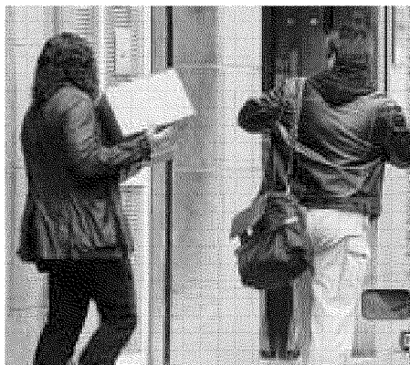
I sequestri alla Asl2 di Savona venerdì