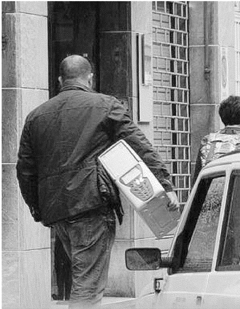
Un computer sequestrato dalla polizia giudiziaria negli uffici Asl 2 di Savona