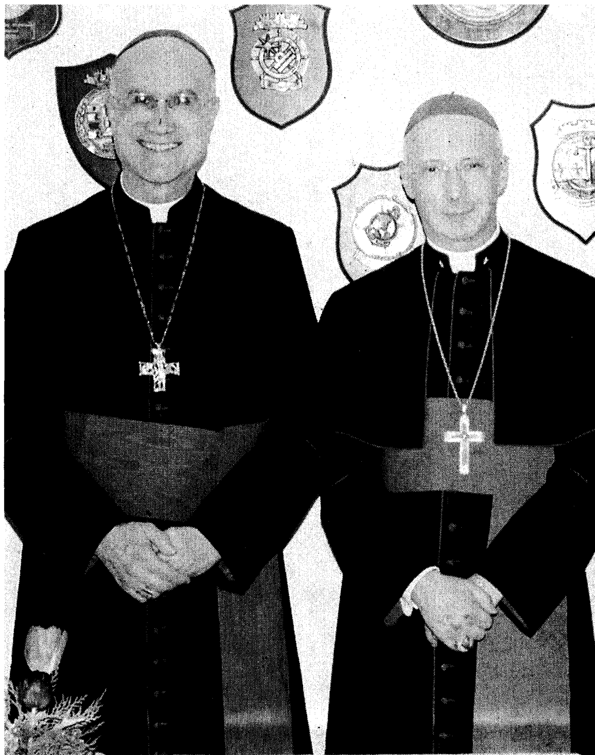
Tarcisio Bertone e Angelo Bagnasco al centro di molte conversazioni degli indagati