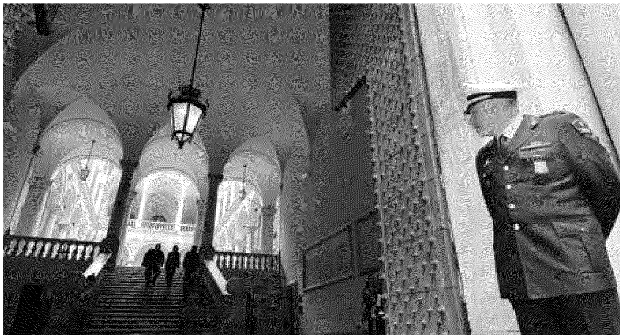
L'atrio di Palazzo Tursi, sede del Comune di Genova. L'amministrazione è scossa dall'inchiesta su "mensopoli"