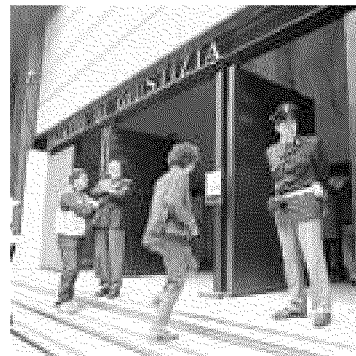
L'ingresso del tribunale