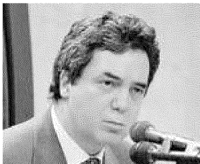
Nando Dalla Chiesa