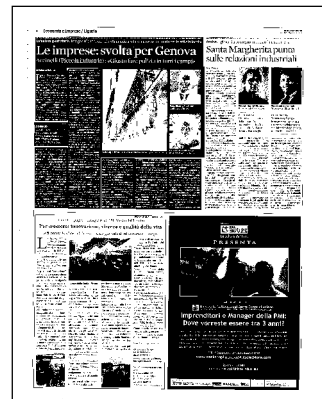
Francesca Accinelli. A capo della Piccola industria ligure