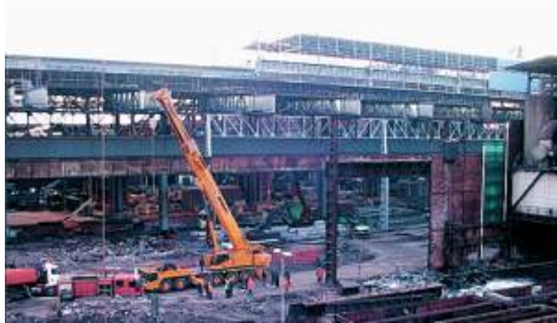
L'intervento dei vigili del fuoco a Cornigliano

Decine di telefonate ai vigili del fuoco per una grossa nube di fumo. Cumulo di rifiuti a fuoco, nessun danno agli operai