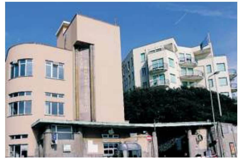
Il Gaslini indirizza i bambini con disturbi dell'alimentazione a psicologi