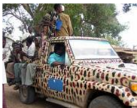
Miliziani delle Corti islamiche a Balad

Gli americani discretamente aiutano l'anticomunista Siad , stesso comportamento che poi terranno più sfacciatamente in Afghanistan una quindicina di anni dopo: meglio Maometto di Marx. Ma il dittatore somalo, che nel 1974 ha portato il suo Paese nella Lega Araba, riceve sostegno finanziario e militare anche dai Paesi del Golfo, Arabia Saudita in testa e Egitto. Quando l'esercito somalo, incalzato da etiopi, russi e cubani si ritira, lascia in Ogaden dietro di sé cellule islamiche, le