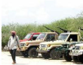
Mezzi moderni per le Corti islamiche a Deyniile (Ap)

di Siad, rovesciato nel gennaio 1991, Al-Ittiad evita di partecipare alle ostilità a Mogadiscio. Nel novembre 1991 restano neutrali anche durante la furiosa battaglia a cannonate tra il presidente ad interim Ali Mahdi e il generale Mohammed Farah «Aidid». Sei mesi prima, in luglio, il Somaliland, il territorio che faceva parte dell'ex colonia britannica, aveva dichiarato l'indipendenza, diventando negli anni un'oasi di sicurezza e di sviluppo. La diplomazia internazionale caparbiamente e con cinismo finora si è rifiutata di riconoscerlo.