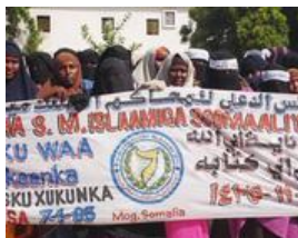
Manifestazione di donne velate a Mogadiscio

Quando scoppia la guerra civile, dopo la caduta