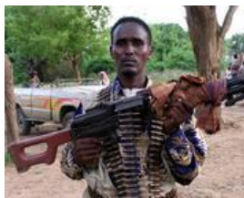
Armi efficienti per gli islamici a Balad

A dispetto delle regole claniche che governano la società somala , il gruppo di Al-Ittiat-al-Islami riesce a organizzare una milizia con uomini provenienti da tutte le cabile. «Il nostro clan è l'Islam», dichiarano orgogliosamente i suoi adepti. Nel dicembre 1992 i signori della guerra somali accolgono a Mogadiscio gli americani con grande entusiasmo. Gli islamici stanno a guardare cosa succede, ma affilano le armi e non esitano a schierarsi qualche mese dopo con il generale Mohammed Farah Aidid, ricercato dai rangers. È il momento in cui arrivano in Somalia gli uomini di Al Qaeda. Mohammed Atef, il vice di Bin Laden morto sotto i bombardamenti americani vicino Kabul nel 2001, e Saif Al Adel, uno dei fondatori del gruppo terrorista, ricercato dall'Fbi, viaggiano nel Paese in lungo e in largo. Promuovono milizie interclaniche ma non disdegnano di finanziare gruppi tribali e combattenti freelance perché attacchino i caschi blu. Tornano poi a Khartoum a riferire allo sceicco del terrore che in quel periodo ha preso casa nel quartiere Riad della capitale sudanese. Islamici e qaedisti partecipano attivamente alla battaglia che si scatena nella notte tra il 3 e 4 ottobre 1993, tra Aidid e americani. Diciotto rangers vengono ammazzati dai miliziani somali che proteggono il loro leader e ne impediscono la cattura. La storica battaglia verrà immortalata nel libro e nel film «Black Hawk Down» (Black Hawk è il nome del modello dell'elicottero abbattuto).