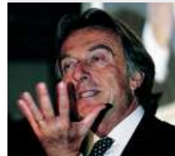
Luca di Montezemolo

... ROMA. «Bisogna mettere in difficoltà psicologica chi paga il pizzo», ma lo Stato deve mostrare «autorevolezza e garantire la certezza della pena». Lo ha chiesto il presidente di Confindustria, Luca Cordero di Montezemolo, ascoltato ieri dalla Commissione antimafia dopo il raid criminale nella sede di Caltanissetta dell'Associazione imprenditoriale.