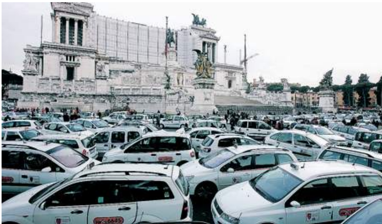
I tassisti romani invadono piazza del Campidoglio per contestare l'annunciata concessione di 500 nuove licenze

DE CAROLIS, GRILLO, G. FERRARI e LENZI >> 2